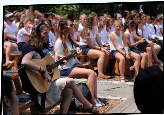
CAMP FIRE SESSION