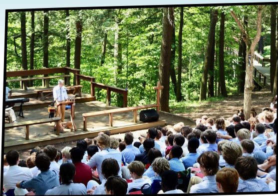
CAMP FIRE SESSION