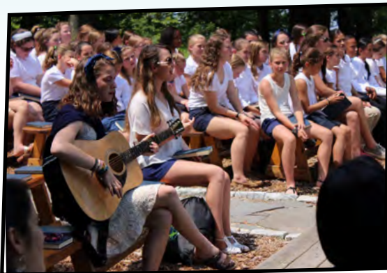
CAMP FIRE SESSION