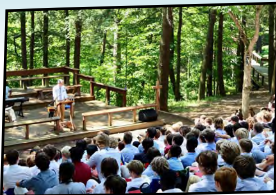
CAMP FIRE SESSION