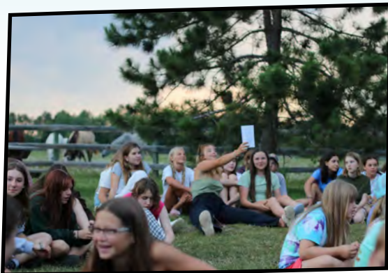
CAMP FIRE SESSION